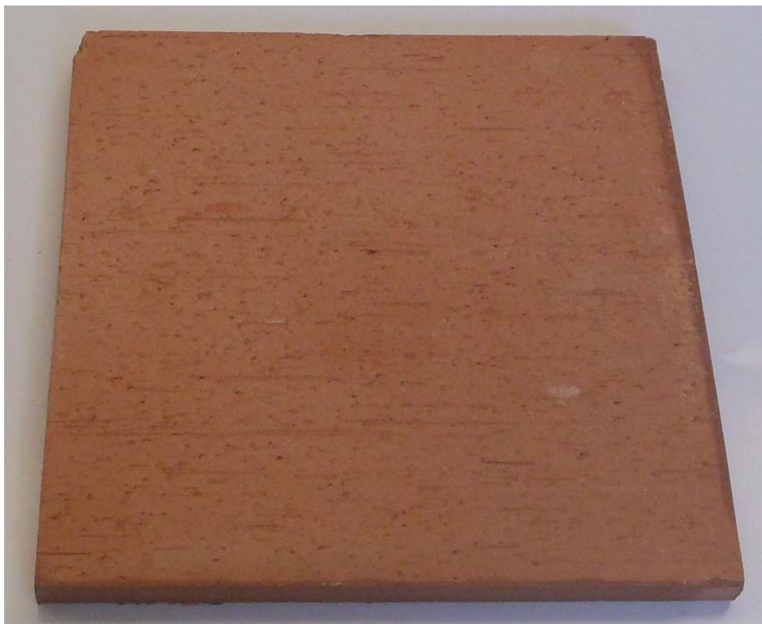
Figura 1. Riproduzione fotografica di un provino tal quale del prodotto “Cotto da pavimentazione linea “Rustica” spessore 2 cm”.