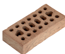
Mattone Semipieno Rugoso