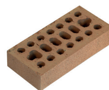
Mattone Semipieno Liscio Sabbiato