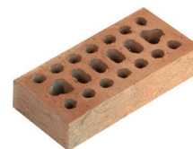
Mattone Semipieno Rugoso Sabbiato