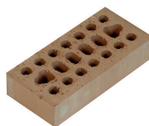
Mattone Semipieno Liscio