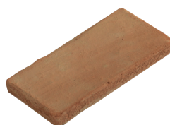
Tavella Fatto a mano