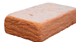
Mattone Antico Casale