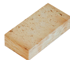
Mattone Pieno Rugoso