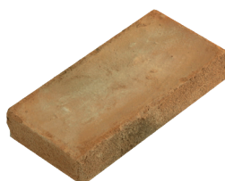
Mattone Fatto a mano