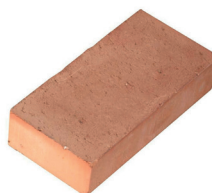
Mattone Pieno Liscio