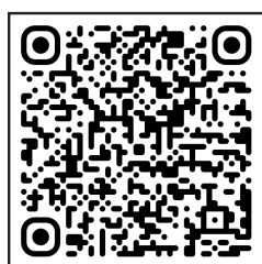
GUIDA POSA IN OPERA PAVIMENTO